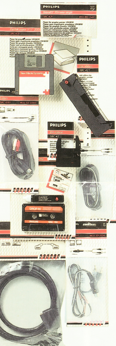
COMPLEET PROGRAMMA ACCESSOIRES.

Voor de gebruiker betekent dat uitwisselbaarheid van – en een ruime keus uit programma's en apparatuur.