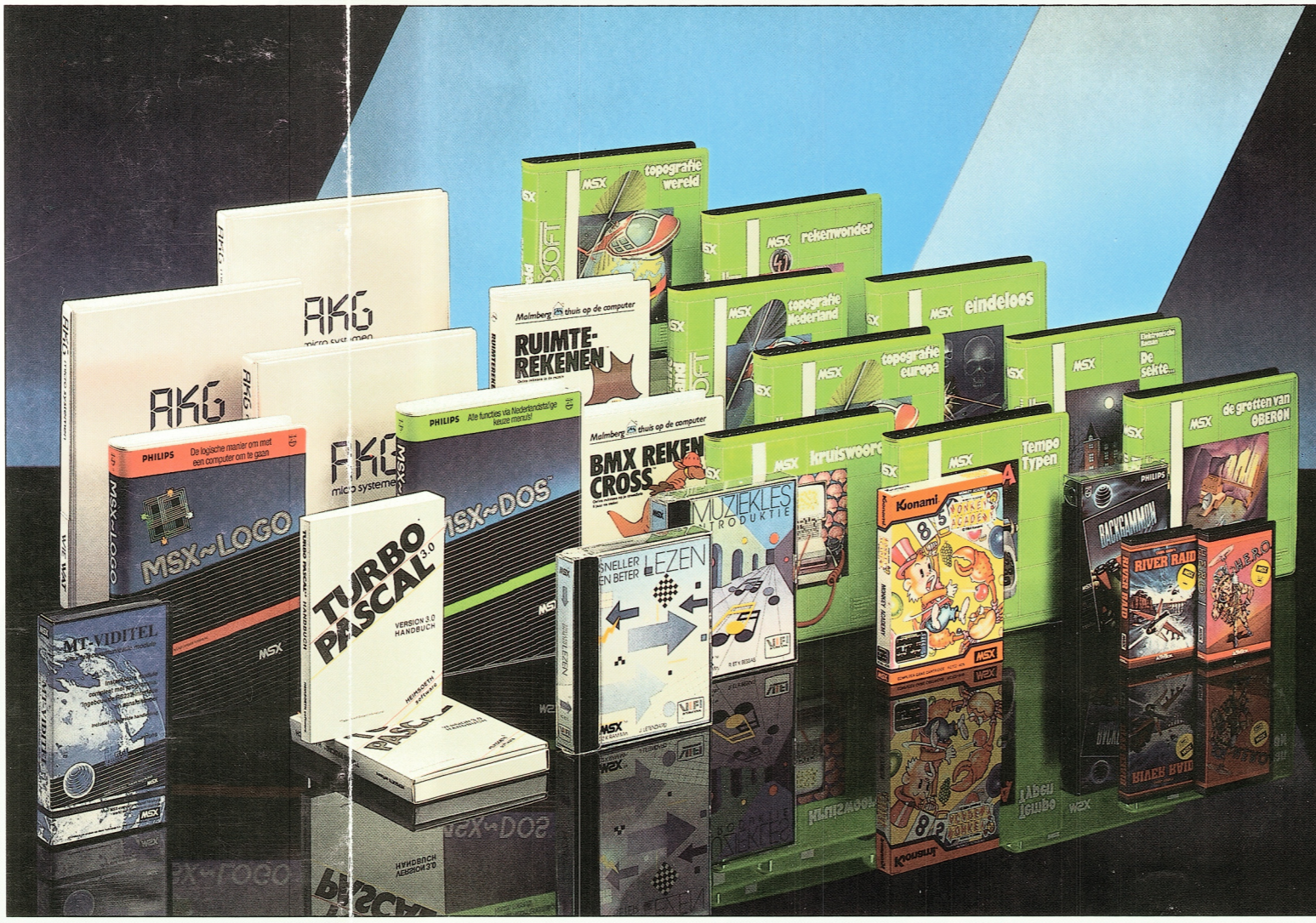
DE KEUS UIT MSX-PROGRAMMA'S IS ENORM.

Indien bij een programma MSX-2 staat vermeld kan dit alleen op een MSX-2 computer draaien. De overige programma's kunnen zowel op MSX-1 als MSX-2 worden gebruikt. Bijgevoerd tot augustus 1986.