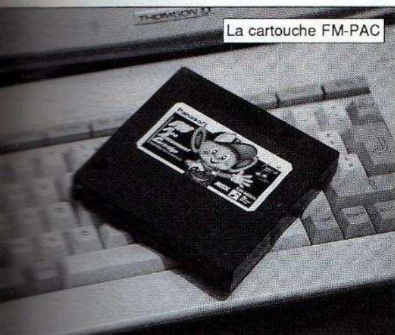
La cartouche FM-PAC

Incroyable mais vrai ! On reparle au Japon du MSX3 , qui pourrait bien ne pas être un leurre. Il s'agirait d'une machine regroupant un MSX2+ et un compatible