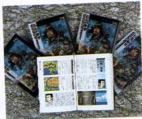
◆信長の野望・戦国群雄伝のオモシロさがギュッとつまった本なのだ。

みんなもよく知っているとおおり、光栄のゲームにはサウンドウェアというバージョンがある。また、単行本も積極的に出しているね。これらは、すべて光栄の社内で作っているものなのだ。他人まかせにしないで、自分たちのゲームに対するイメージをはっきりと打ち出したい! ということらしい。