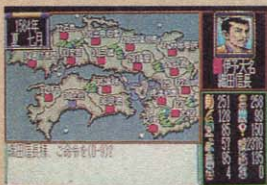
▲さあ、残っているのは長宗我部軍だけだ。あと一息というところだね。

ここではエンディング画面は見せるわけにはいかないんだけど、キミもがんばって全国统一してみてくれ。これで、誌上再現レポートは終わりにしよう。