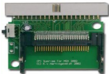
Add-on kaart voor Sunrise ATA-IDE interface

Add-on kaart voor de Sunrise ATA-IDE interface Losse Compact Flash ATA-IDE