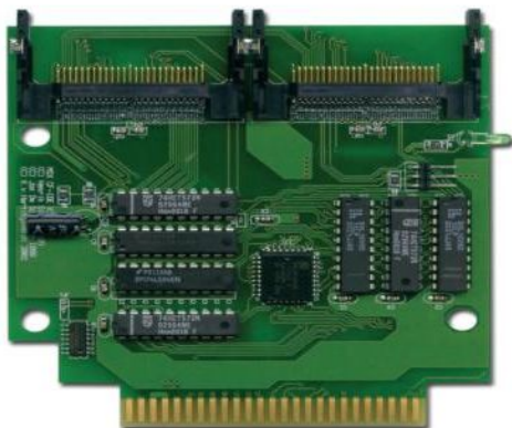
Compact Flash ATA-IDE

Prijzen: Add-on kaart voor ATA-IDE interface € 28,50 Compact Flash ATA-IDE € 63,55