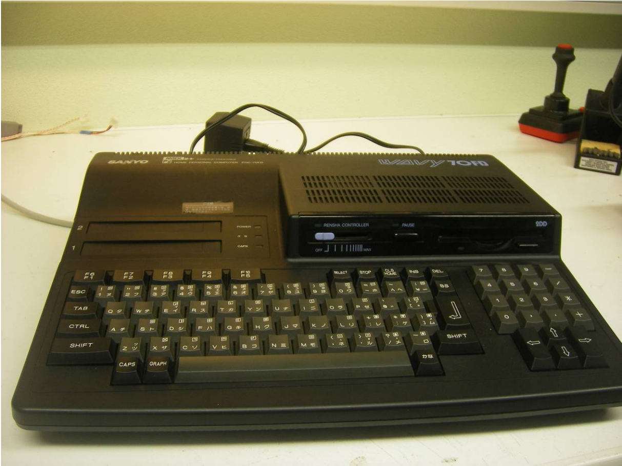
Sanyo PHC-70FD MSX-2+ computer