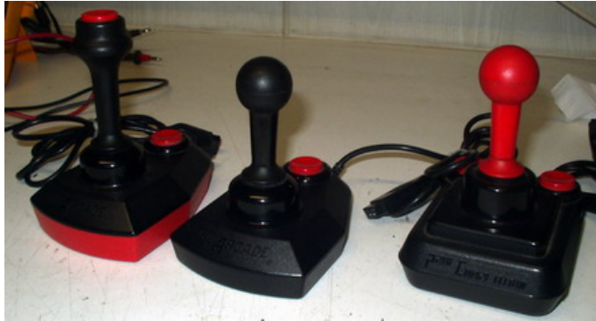
Verschillende Arcade Joysticks

Er zijn diverse soorten Arcade Joysticks. Voor de MSX computer zijn dit de beste Joysticks en zeker de versies met twee onafhankelijke vuurknoppen. Na vele uren speelplezier kan het gebeuren dat de Joystick niet meer goed werkt. Echter zijn deze Joysticks eenvoudig te repareren.