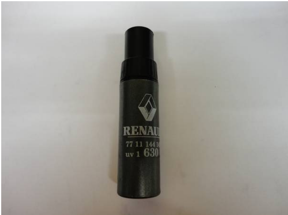
Lakstift Renault, kleurnummer 630

De Philips MSX Computers zijn antraciet van kleur en het is moeilijk om de juiste kleur te bepalen. Ik gebruik altijd een lakstift van Renault, kleurnummer 630, of een spuitbus in dezelfde kleur voor de grotere stukken, zoals een toetsenbordkap van een Philips VG 8235.