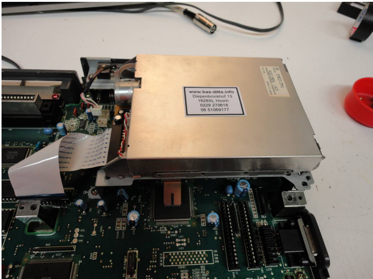
De diskdrive in een Panasonic FS-A1ST

Het meest voorkomende probleem is een snaar welke is uitgedroogd. Een oorzaak hiervan kan zijn dat de diskdrive een hele tijd niet gebruikt is.