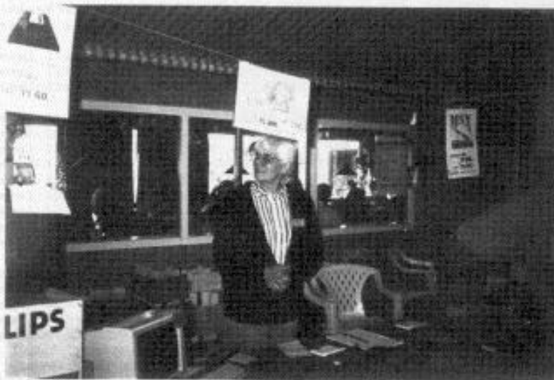
ZANDVOORT, 18 SEPTEMBER 1993